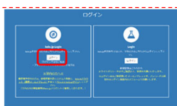
Keio.jpログインメニュー