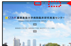
受講管理システムWebページ