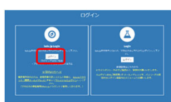
Keio.jpログインメニュー