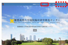
受講管理システムWebページ